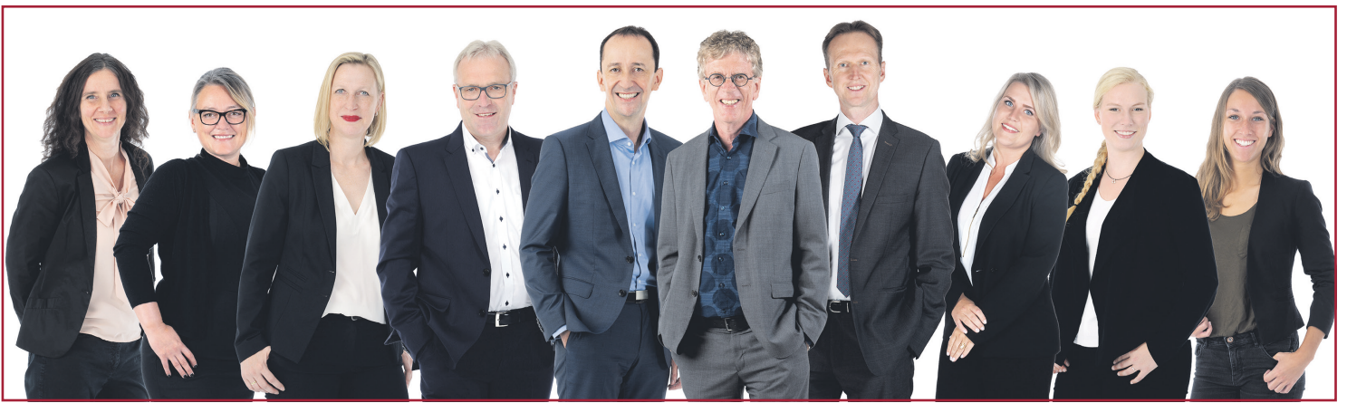
Das Assella-Team.